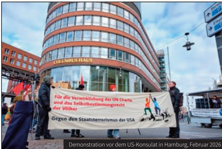
Demonstration vor dem US-Konsulat in Hamburg, Februar 2026

Anlass gibt es genug: Der völkerrechtswidrige Überfall der USA auf Venezuela im Januar und die Bedrohung Kubas machen eine vertiefte Zusammenarbeit zwischen Solidaritäts- und Friedensbewegung erforderlich. Wir haben zu einem bundesweiten Aktionstag am 14. Februar „Für die Verwirklichung der UN-Charta und das Selbstbestimmungsrecht der Völker – Gegen den Staatsterrorismus der USA“ aufgerufen. In Mai haben wir einen Aktionstag zur Solidarität mit Kuba und der kubanischen Studierendenföderation auf dem Campus durchgeführt.