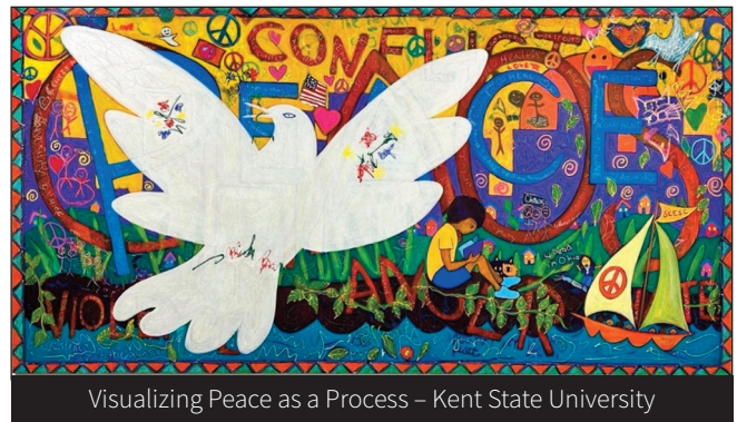
Visualizing Peace as a Process – Kent State University