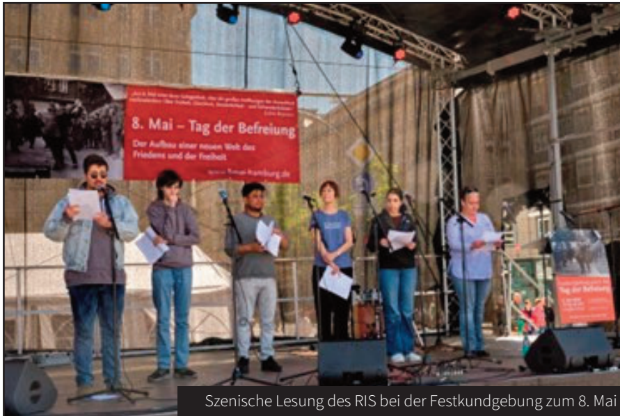
Szenische Lesung des RIS bei der Festkundgebung zum 8. Mai

Der Text ist auf unserer Homepage zu finden und alle Beiträge sind hier nachzulesen, zu hören und zu sehen: https://8mai-hamburg.de/8-mai-2026/